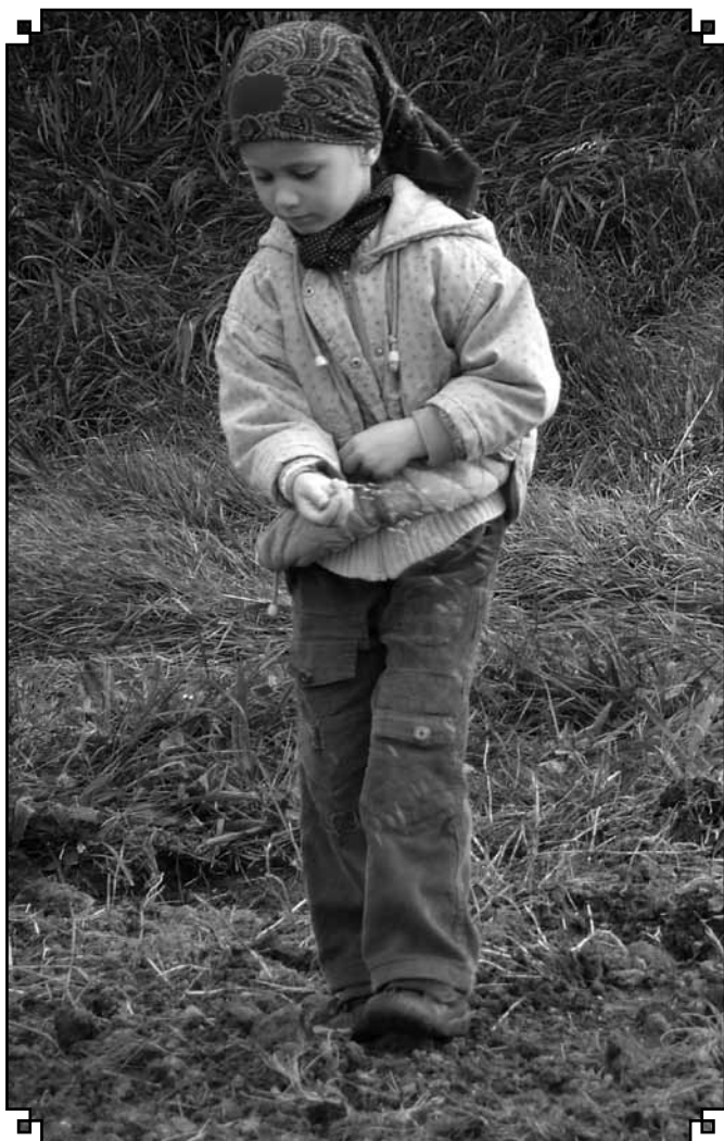
A Lázi-dombon is földre kerül a mag. Március 17-én a Zóka-hegyen mindenkit oda várunk

♦ A LÁZI-DOMBI KULTURÁLIS EGYESÜLET KIADVÁNYA ♦ 2012 MÁRCIUS 15. ♦