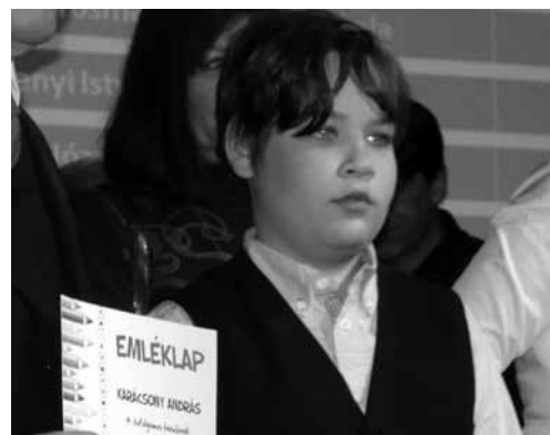
Az Apáczai Csere János Könyvkiadó által meghirdetett országos versíró versenyen a verset díjra méltónak ítélte a zsűri, saját korosztályában.